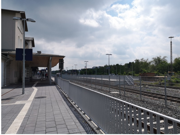
Zuwegung zum Bahnsteig, Blick auf Bahnsteigdach, Haus- und Mittelbahnsteig