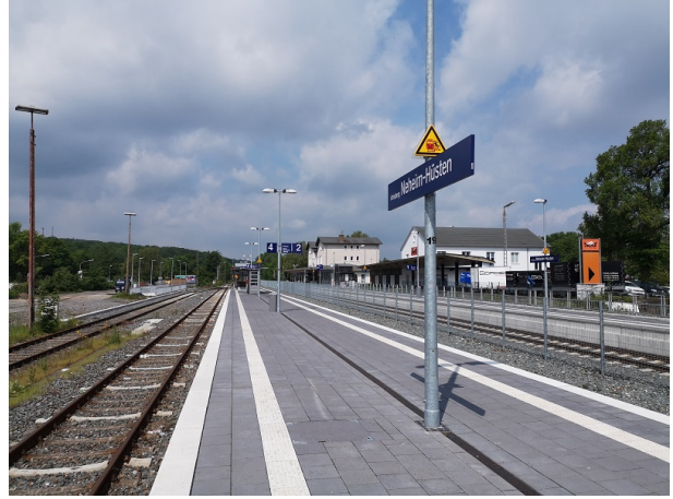
Mittelbahnsteig mit Querungsbarriere, Hausbahnsteig