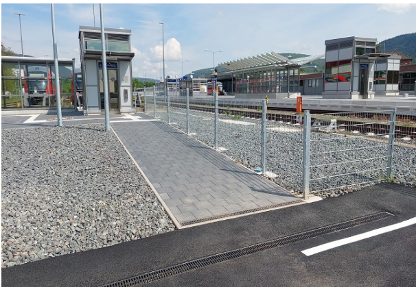
Zugang Personenunterführung und Aufzug Nord