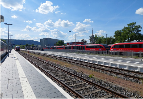
Haus- und Mittelbahnsteig