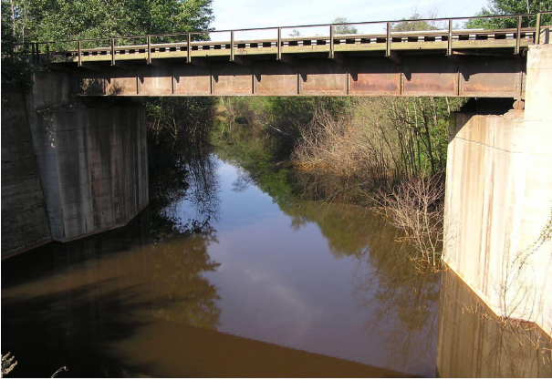
Abzubrechende alte Stahlbrücke