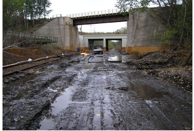
Baustelle während der Wasserhaltung