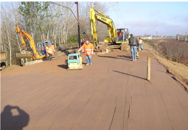
Herstellung des Damms in der Sperrpause