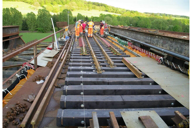
<p>Montage und Ausrichten von Brückenbalken</p>