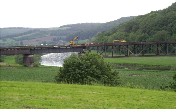
<p>Arbeiten in großer Höhe auf der Weserbrücke</p>