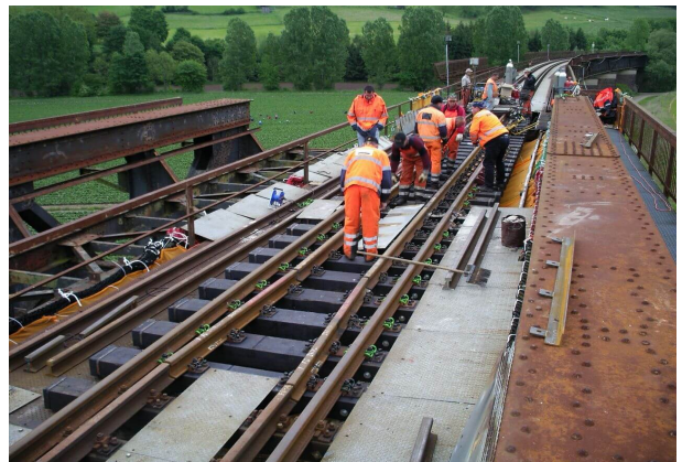
<p>Einbau einen neuen Schienenausuges</p>