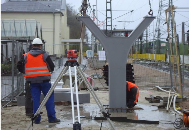
Einbau Stahlstütze der Fußgängerbrücke