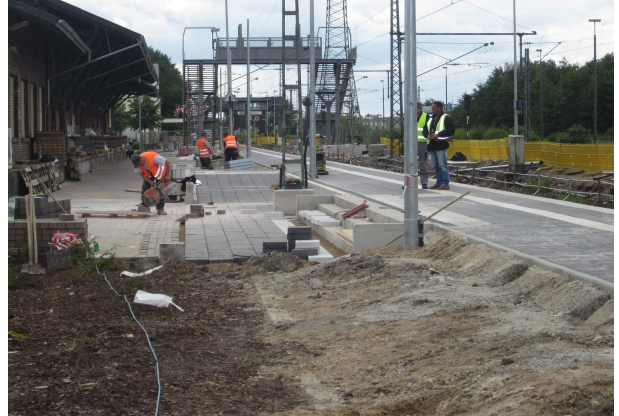
Pflasterarbeiten Bahnsteig 1