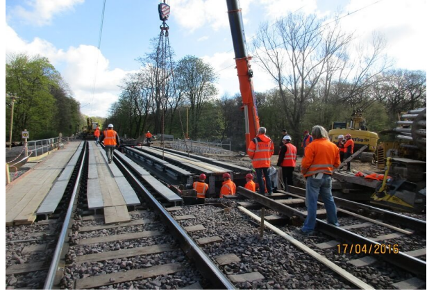
Einbau einer Hilfsbrückenkette