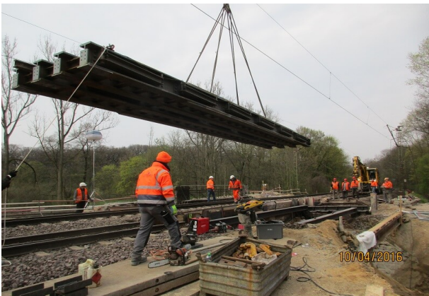
Einbau einer Hilfsbrücke