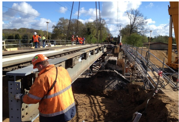
Einbau einer Hilfsbrücke als Teil einer Hilfsbrückenkette