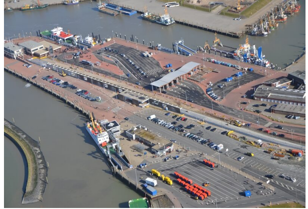
Ansicht Fähranleger Norddeich