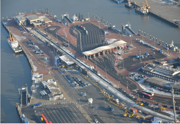
Ansicht Fähranleger Norddeich