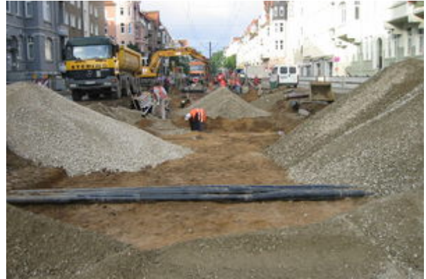
Einbau der Kabelschutzrohre für den Bahnsteig und Einbau der Mineraltragschichten