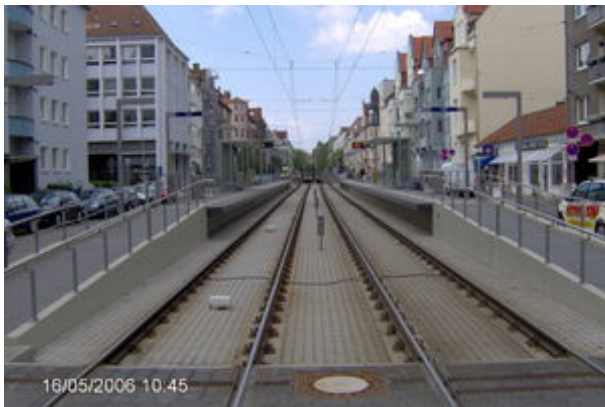
Hochbahnsteig mit Gleis auf Stahlbetonlängsbalken