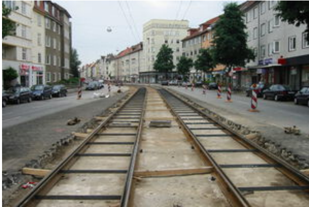
Rillenschienengleis Ri 60 mit provisorischer Kantholz-Aussteifung