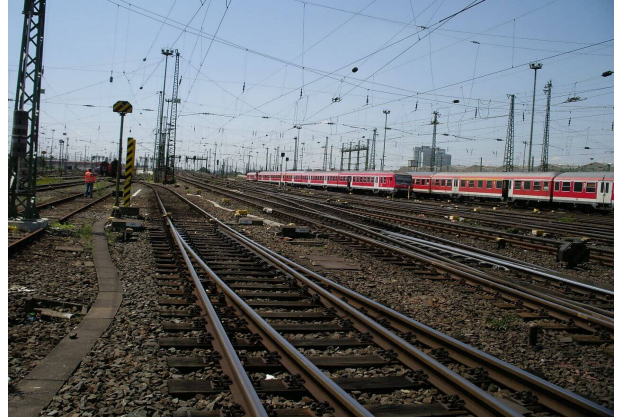
<p>Gleisrampe vor dem Umbau</p>