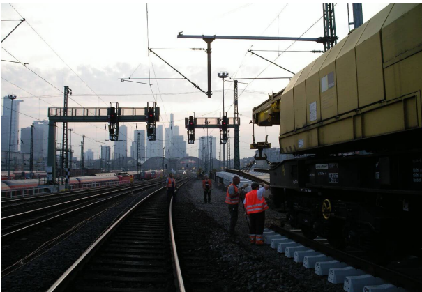
<p>Verlegen der vormontierten Gleisjoche mit Kran</p>