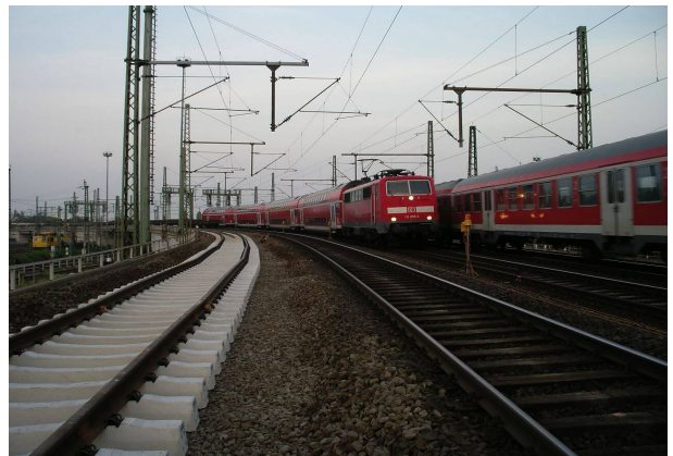
<p>Auf dem Schotterplanum verlegtes Gleis</p>