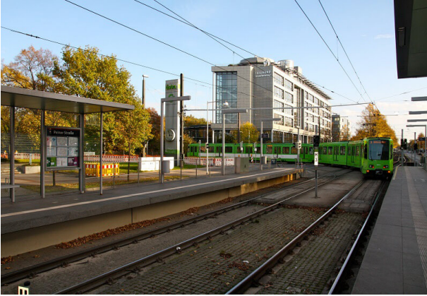
<p>Einfahrt in den Betriebshof</p>