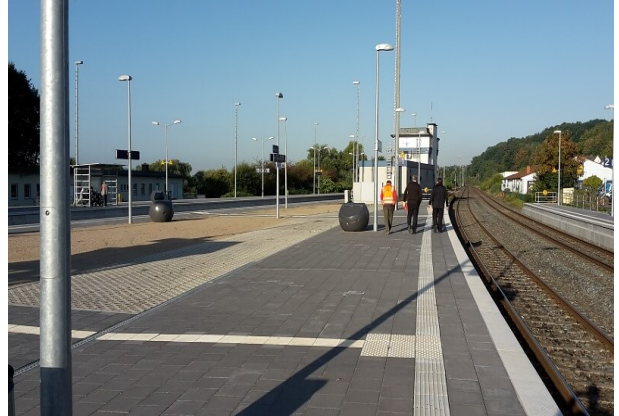
Ansicht Innenfläche Bahnsteig 1 / 11