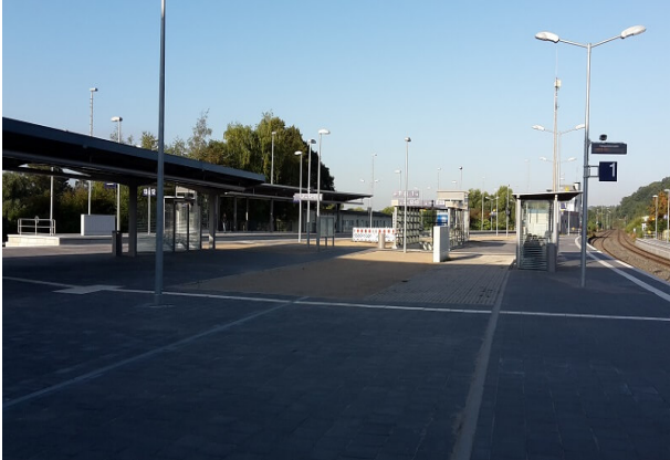
Ansicht Innenfläche Bahnsteig 1 / 11