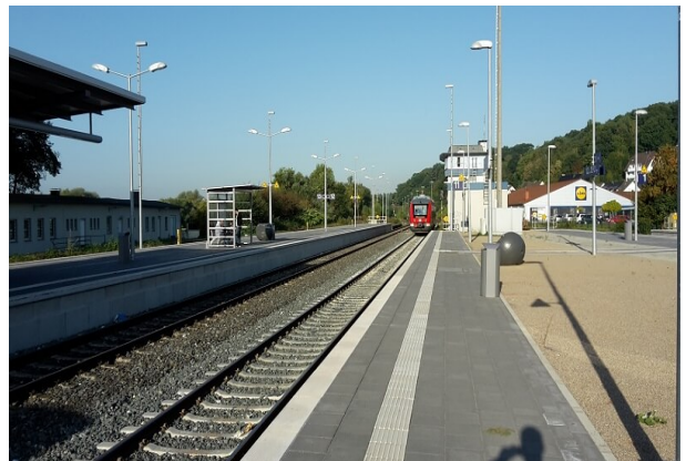
Ansicht Bahnsteig 11 + 12/13