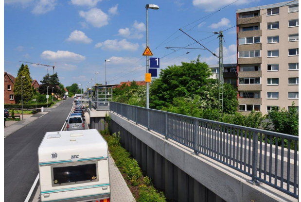
rückseitiger Bahnsteig, Ansicht Spundwand