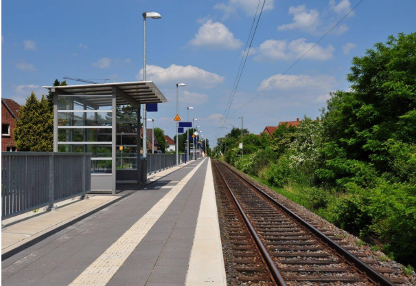
fertiggestellter Bahnsteig (eingleisige Strecke)