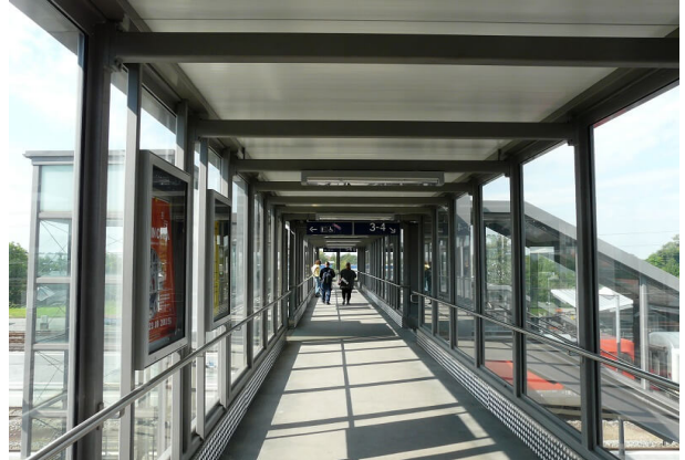
Sanierte Personenüberführung über die Gleise 2-4 Neue Einhausung Personenüberführung und Treppenanlagen