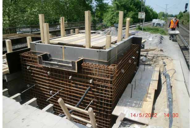
Verkehrsstation vor Beginn der Arbeit Breitening Aufzugschacht zum barrierefreien Anschluss der Personenunterführung