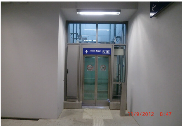
Fertiggestellter Aufzug in der Personenunterführung