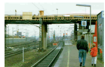
Mehrfeldbrücke über einem Bahnhof (1997)

2013 wurde der historische Bahnhof erbaut Mitte des 19. Jahrhunderts, in Elze erworben und kernsaniert. Das Vertriebszentrum der A.F. Hausbau wurde dort eingerichtet. Damit wird den Kunden und Interessenten nunmehr eine weitere Möglichkeit geboten, sich in modern eingerichteten Räumen umfassend beraten zu lassen.