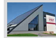
Hauptplatz Albert Fischer Hausbau GmbH