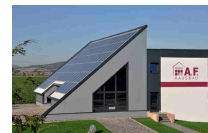
Das Büro- und Ausstellungsgebäude der Albert Fischer Hausbau GmbH