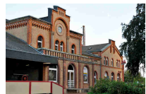
Der Bahnhof Elze mit den Büros für die Planungsabteilung und den Vertrieb