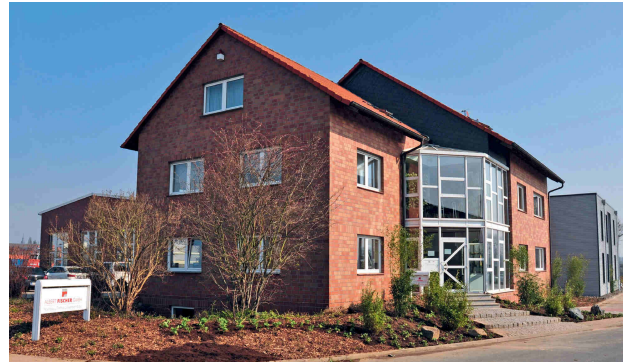
Die Firmenzentrale der Albert Fischer GmbH

Durch qualitativ hochwertige Arbeit, zuverlässige Auftragsabwicklung und eine große Flexibilität wuchs die Albert Fischer GmbH und damit auch die Anzahl der Mitarbeiter stetig. Bis heute werden alle Prozesse aufeinander abgestimmt und optimiert. Durch die gebündelte Erfahrung werden so selbst schwierigste Bauaufgaben im Ingenieurbau lösbar. Wir sind bereit für