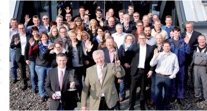
„Der Erfolg unseres Unternehmens basiert auch auf der Stetigkeit unserer Mitarbeiter.“

Unsere erfahrenen Mitarbeiter zeichnen sich durch über viele Jahre erworbene Fähigkeiten, aber insbesondere durch unschätzbare Praxiswissen aus. Dieses für das Unternehmen zu sichern und an junge Mitarbeiter wei-